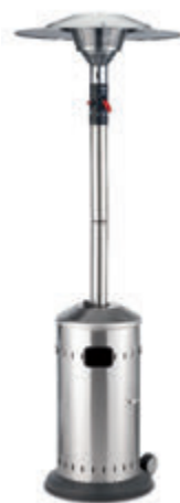
EVENT s. 9