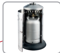
Úložný priestor pre 10 kg propánovú fľašu