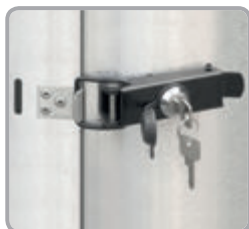
Uzamykateľný dverový uzáver