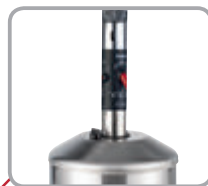
Zasúvateľný stĺpik horáka