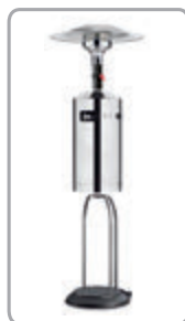
Úložný priestor pre 10 kg propánovú fľašu