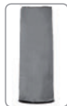
Pláštenka (č. 5662)