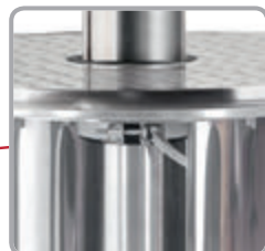
Vnútrotný zafahovací mechanizmus