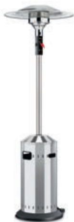
ELEGANCE s. 7