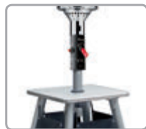
Zasúvateľný stĺpik horáka