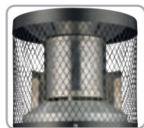
Nastaviteľný odrazový systém