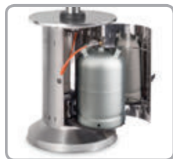
Úložný priestor pre 10 kg propánovú fľašu s vysúvateľnou podestou