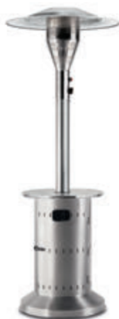
COMMERCIAL s. 12-13