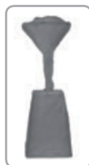
Pláštenka (č. 5664)