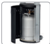
Úložný priestor pre 10 kg propánovú fľašu

Tento ohrievač predstavuje revolúciu medzi plynovými terasovými ohrievačmi na trhu. Je registrovaný ako úžitkový a priemyselný vzor. ECOLINE ohrievač žiari teplo veľmi efektívne, čím poskytuje obrovské úspory a zároveň takmer nezanecháva žiadne stopy na životnom prostredí. Elegantný vzhľad ohrievača ECOLINE bude vítaný na akejkoľvek terase, či už pri rodinnom dome alebo v štýlovej reštaurácii.