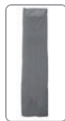
Pláštenka (č. 5665)