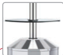
Sklenený stolík ako voliteľné príslušenstvo