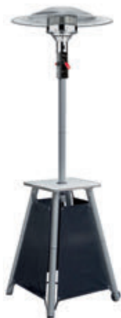
TRENDSTYLE s. 8