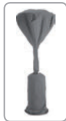
Pláštenka (č. 5662)

Výkon 6 kW horáka Eco Green poskytuje rovnaké množstvo tepelného žiarenia ako 12 kW horák bežného patio ohrievača. Jeho vlastnosti chrániace životné prostredie stoja obzvlášť za zmienku: využívaním 6 kW Eco Green horáka sa znížia emisie CO 2 o 50 %. Používaním 6 kW horáka Eco Green znížite spotrebu plynu a teda zásadným spôsobom o 50 % znížite aj prevádzkové náklady.