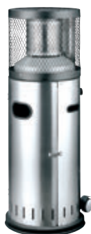
POLO 2.0 s. 11