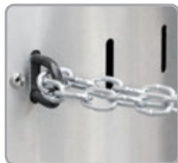
Očko pre zaistenie ohrievača refazou